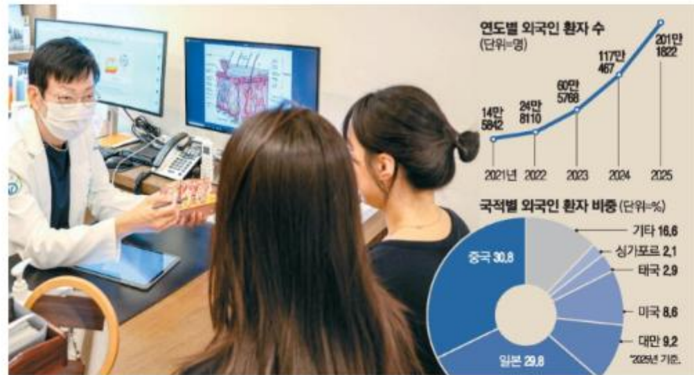
24일 서울 강남구의 한 피부과에서 외국인들이 피부 미용 관련 시술 상담을 받고 있다.

올리브영서 화장품 싹쓸이 中 환자 일년새 2배 늘어 1위 무비자입국 정책 전국 확대돼 부산 찾는 환자도 2.5배 증가